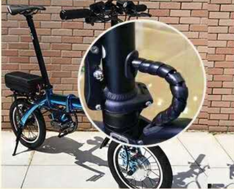
自行车刹车线保护